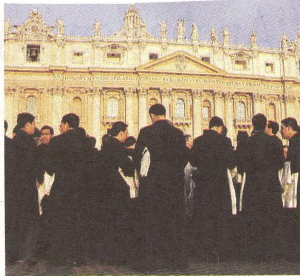
I fondi dell'8 per mille servono anche per gli “stipendi” del clero

Chiesa, partendo appena da 36% delle dichiarazioni a suo favore, di incassare quasi il triplo.